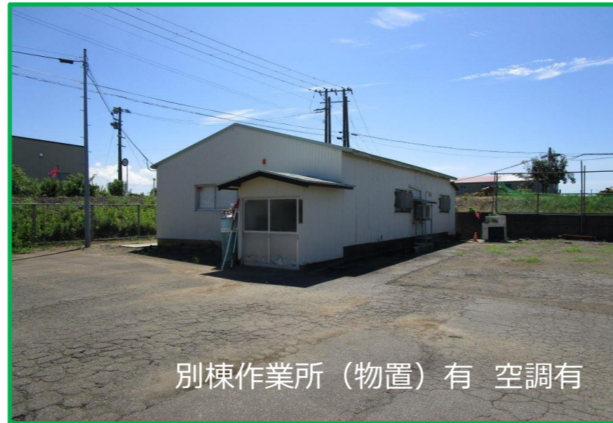
別棟作業所(物置)有 空調有