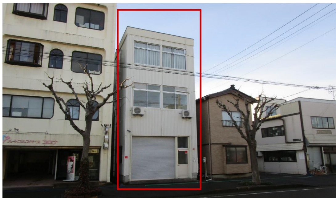
※食品会社社員宿舎として利用中